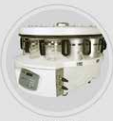
Processador de Tecidos