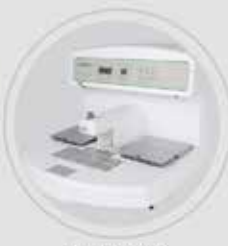
Central de Inclusão