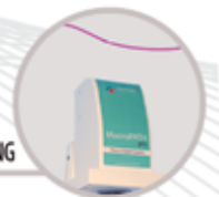
MACRO DIGITAL IMAGING